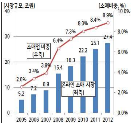
< 온라인 소매의 판매액 추이 >